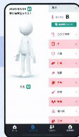
ウィズウェルネス画面

※15歳未満の方が持つアカウントである「こどもアカウント」のマイデータは、本人と法定代理人のアカウント以外とは共有できません。