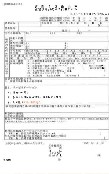
(採血、血液検査の実施)

在宅治療の患者さまへ、スターク訪問看護ステーションを通じて、在宅での血液検査が可能になりました。ドクター指示により、採血から血液検査まで、スターク訪問看護ステーションが行います。